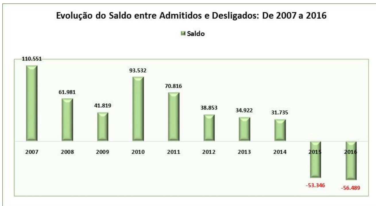
Figura 4.3.1: Gráfico da Evolução do Saldo entre Admitidos e Desligados: De 2007 a 2016.