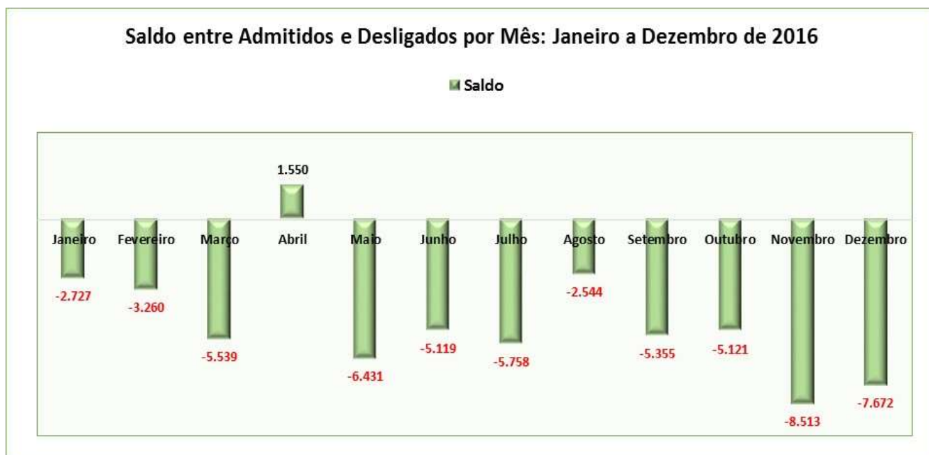
Figura 4.2.2: Gráfico do Saldo entre Admitidos e Desligados por Mês: Janeiro a Dezembro de 2016.