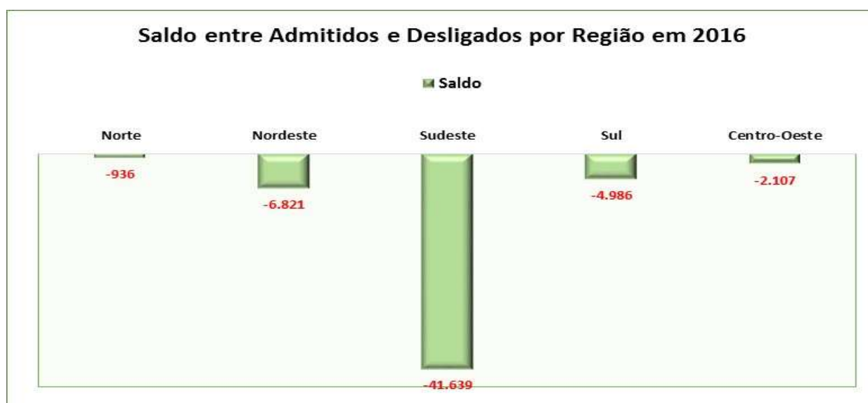
Figura 4.2.1: Gráfico do Saldo entre Admitidos e Desligados por Região no Ano de 2016.