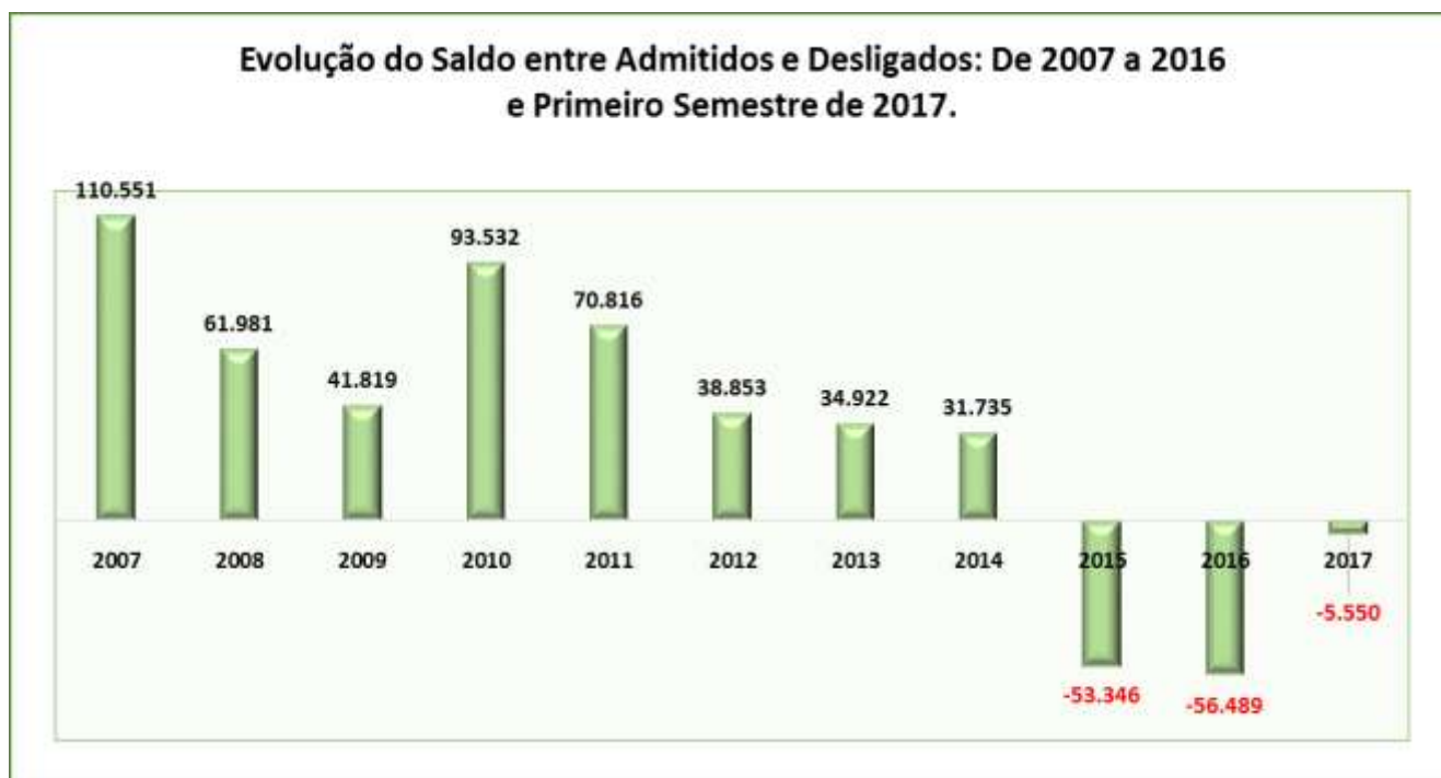
Figura 4.1.1: Gráfico da Evolução do Saldo entre Admitidos e Desligados: De 2007 a 2016 e Primeiro Semestre de 2017.